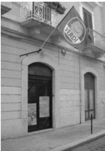
La nuova sede dei Verdi a Trani

I Verdi, pertanto, "stanno realizzando un incontro con i cittadini e prepareranno un documento tecnico giuridico per fornire a tutte le pubbliche amministrazioni gli strumenti minimi per ricorrere avverso questo pericoloso e superficiale bando".